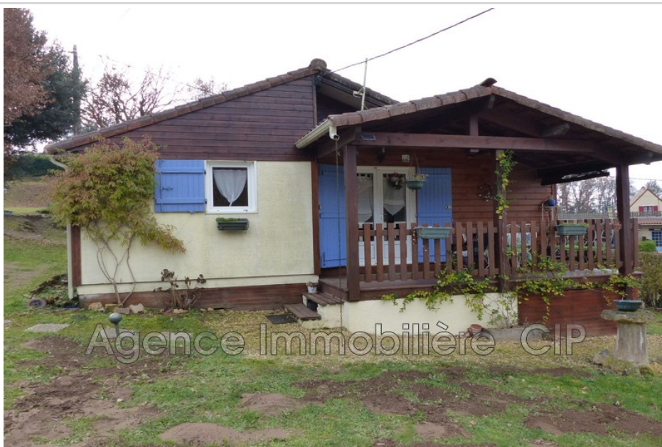
Chalet 6523 Domme

Située dans la vallée de la Dordogne à deux pas de la Bastide de Domme ce bien est idéal pour un investisseur. Ce chalet est composé d'une pièce de vie, d'une cuisine US équipée et aménagée, d'une chambre d'une salle d'eau et d'un WC indépendant - Double vitrage, chauffage électrique, petite terrasse, place de parking - Bien en copropriété horizontale avec piscine collective - Charge estimé à 400 €